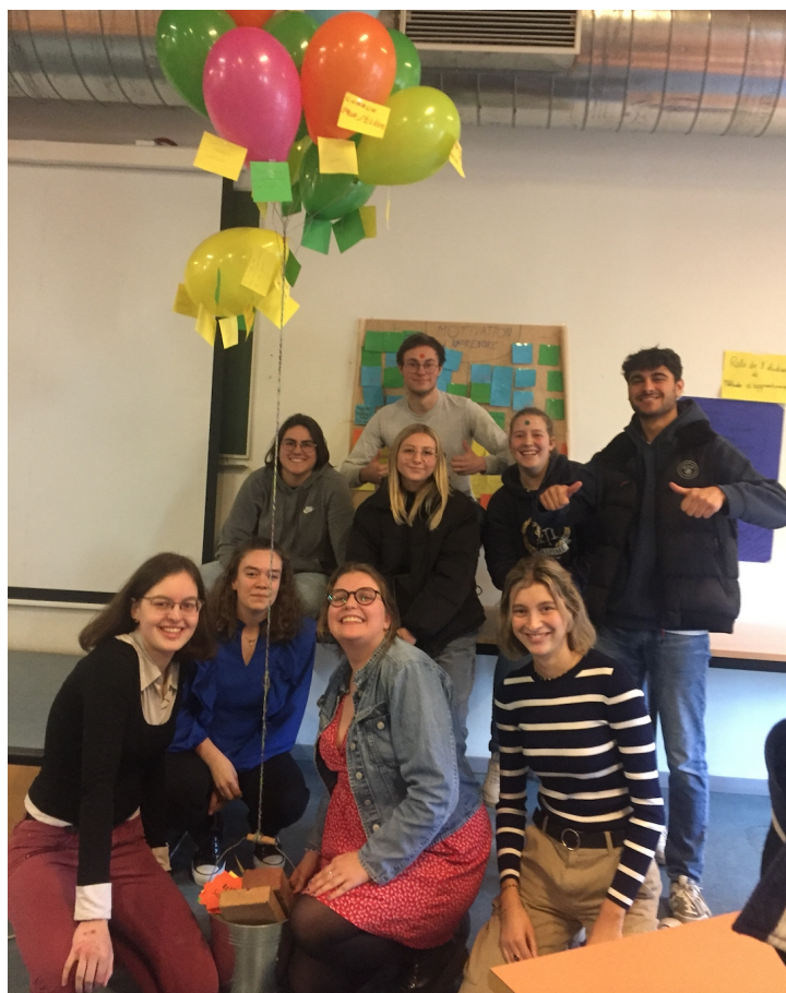
Délégués étudiants à la fin d'un Forum