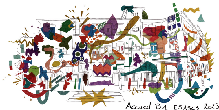
L'école, vue par les étudiants - animation de rentrée.