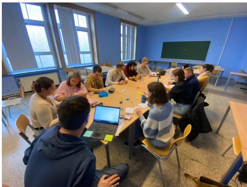
Délégués étudiants préparant le forum

L'équipe pédagogique s'efforce de relever le même défi auquel les étudiants seront confrontés une fois diplômés : réduire autant que possible les obstacles à la participation et réunir les conditions favorables à une inclusion véritable, dans une démarche orientée vers la justice sociale.