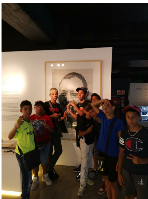
Des jeunes du Centre socioculturel de Prélaz-Valency au FC Barcelone Museum, devant l'image de Hans-Joan Gamper

Ce qui change est que jeunes et professionnels, par les discussions et les activités, ont pris conscience de leurs divergences et cherchent constamment des équilibres. Leurs « genres de