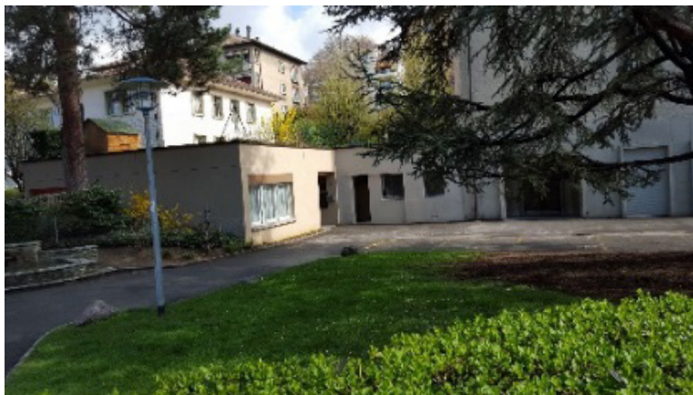
Vue du Centre socioculturel de Prélaz-Valency.

Le Centre est géré en binôme par la Fondation pour l'animation socioculturelle lausannoise (FASL), dont la fonction est d'allouer un budget et le personnel salarié, et une association d'habitants de quartier définissant le programme d'activités.