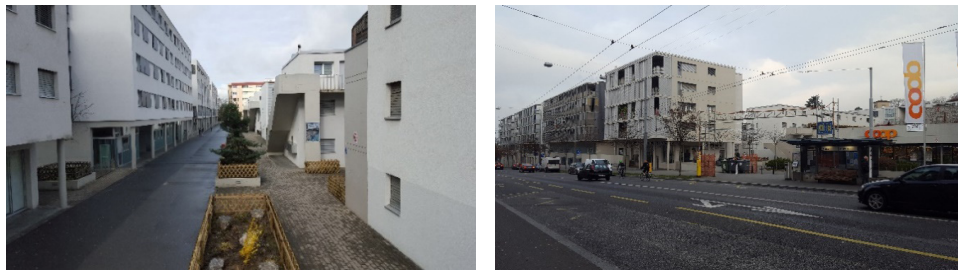
Le complexe résidentiel des « Jardins de Prélaz »

Les jeunes qui fréquentent le Centre viennent en grande majorité d'un complexe résidentiel situé entre Prélaz et Valency : les Jardins de Prélaz.