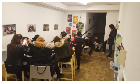
Les accueils libres jeunes au Centre socioculturel de Prélaz-Valency.

Par contre, pour l'équipe de professionnels du Centre, l'animation socioculturelle et, donc, le travail vers la jeunesse, sont des outils de prise de conscientisation pour le changement social. Ces deux sens n'ont pas su, au cours des années, se composer en une signification commune et même leur cohabitation se manifeste laborieuse d'autant plus que les jeunes tendent à reproduire au Centre les pratiques agressives qu'ils vivent à l'extérieur.