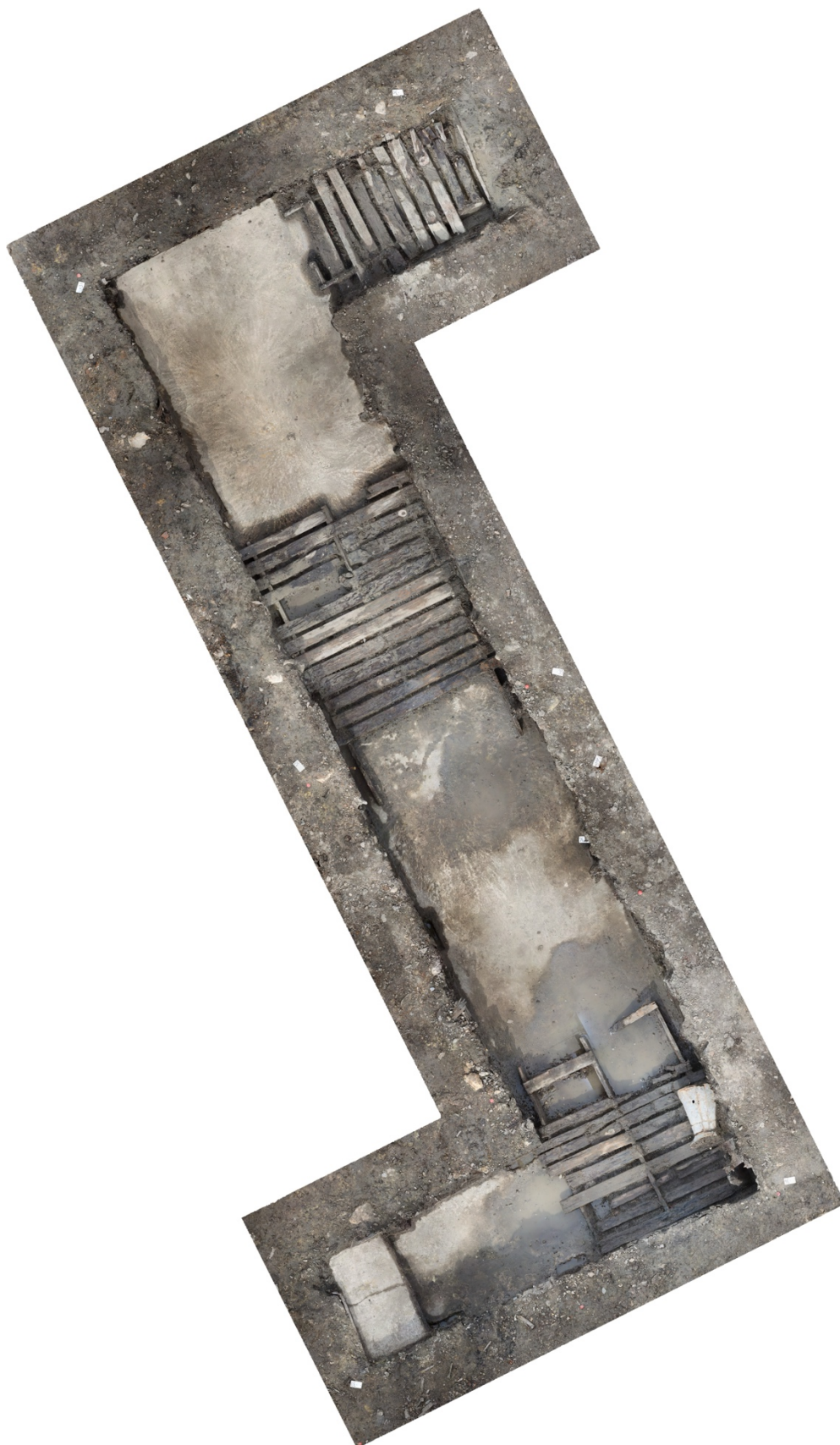
Figure n° 10 : Tranchée-abri découverte sur le site de l'arsenal de Rochefort, © Dép.17