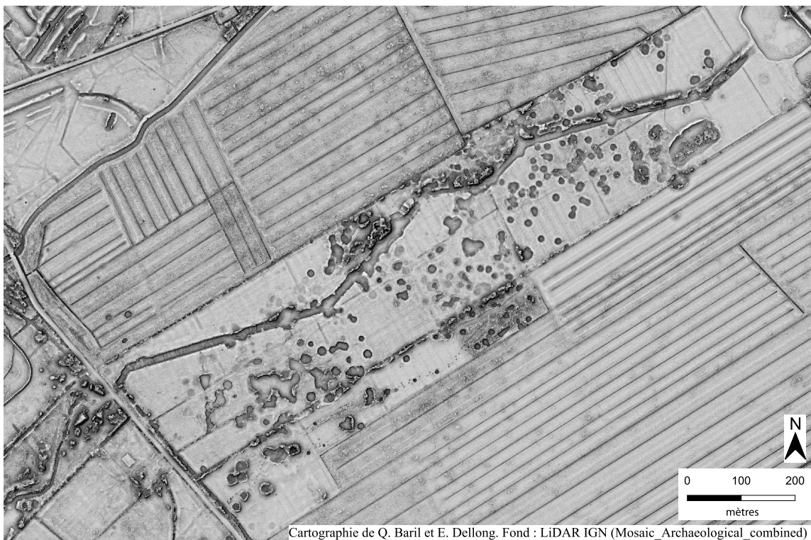
Figure n° 2 : Levé LiDAR illustrant de nombreux impacts de bombardements dans le secteur du fossé antichar au sud de Soulac-sur-Mer (33), témoignant de la dureté des combats