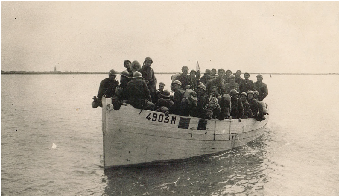
Figure n° 3 : Photographie prise entre Marennes-Hiers-Brouage et l'île d'Oléron lors de « l'opération Jupiter », débarquement maritime lancé le 30 avril 1945, © Collection particulière

Les combats se poursuivent en direction de la poche de La Rochelle. Le troisième assaut est tourné vers l'île d'Oléron, un territoire dominant l'estuaire de la Gironde et l'entrée des pertuis menant à La Rochelle. L'opération débute par une phase de débarquement, menée à l'aide de chaloupes et de barges réquisitionnées, mais également de bateaux de débarquement prêtés par l'armée américaine. Après deux jours de combats parfaitement coordonnés, les dernières forces allemandes se rendent le 1 er mai 1945 à Saint-Pierre-d'Oléron.