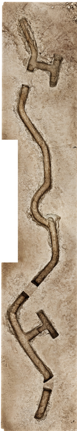
Figure n°8 : Tranchée défensive découverte au sein d'une positionnée fortifiée allemande dans le secteur de Royan