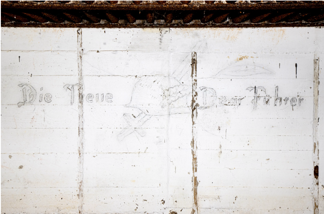
Figure n°7 : Fresque conservée dans un abri allemand dans le secteur de La Rochelle