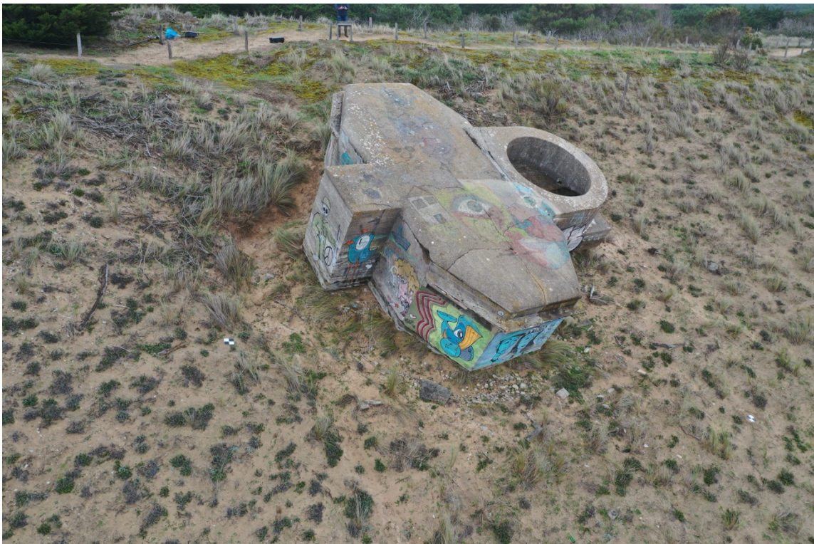
Figure n° 1 : Poste et cuve de télémétrie de la batterie française à Sainte-Marie-de-Ré située sur l'île de Ré (17)

batteries sont construites entre 1939 et 1940, comme à Sainte-Marie-de-Ré, où le béton armé était déjà massivement employé pour défendre le littoral. En cas de mobilisation et de guerre, le rôle des ports, comme ceux de Bordeaux ou de La Rochelle, était crucial dans l'approvisionnement de l'armée. La preuve en est qu'au printemps 1940, l'activité y est importante par le débarquement de fournitures et de ravitaillements pour les troupes, de matériel provenant des États-Unis ou d'Australie, mais également par l'arrivée de troupes coloniales. Dans les villes, la préparation à un conflit se matérialise essentiellement par la mise en place des mesures de défense passive. Prenant la forme de lois et de décrets à partir de 1935, ces mesures doivent permettre d'alerter, de préparer des zones de repli en cas de bombardement et d'incendie, et d'assurer la protection des populations à l'intérieur d'abris (cave, tranchée, abri bétonné, cavité). Des réseaux de tranchées-abris sont ainsi mis en place sur les allées, les places et les différents espaces disponibles, comme aux Quinconces à Bordeaux ou encore au cœur du complexe industriel de l'arsenal de Rochefort.