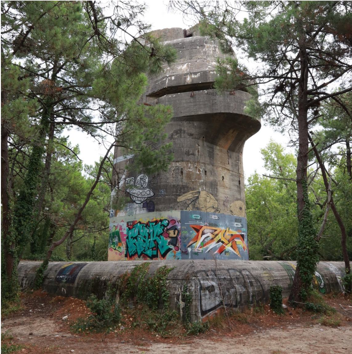
Figure n°11 : Poste de commandement surmonté d'une tour d'observation et de direction de tir situé sur l'île de Ré et inscrit MH en 2002 (Batteries Karola-Kora-Kathe)