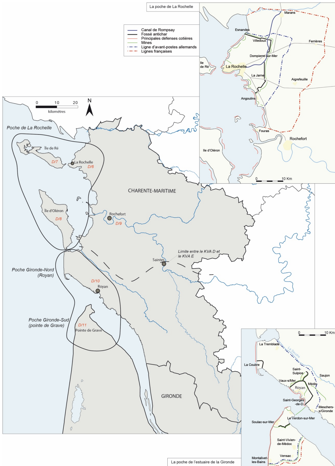
Figure n°4 : Les poches de résistance allemandes en Charente-Maritime et Gironde, © T. Aubry et Q. Baril