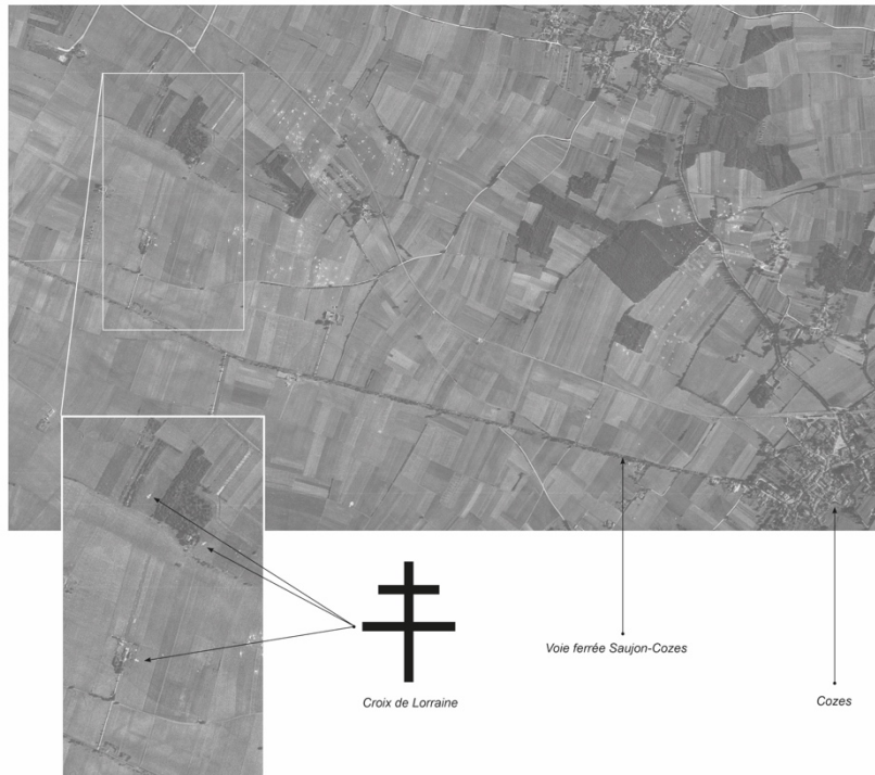
Figure n°9 : photographie aérienne prise en juillet 1945 au nord de Cozes et de la voie ferrée Saujon-Cozes. On distingue parfaitement trois Croix de Lorraine en lisière d'un bois et près d'une ferme, mais également, plus au nord, de nombreux cratères d'obus ou de bombes

dans la mesure où ces positions s'apparentent au front constitué lors de la Première Guerre mondiale. Lignes de tranchées, boyaux de communication, abris semi-enterrés et positions de combat aménagées en rondins et en terre structurent ces positions, aujourd'hui invisibilisées par la remise en culture des terrains (Figure n°8 en annexe).