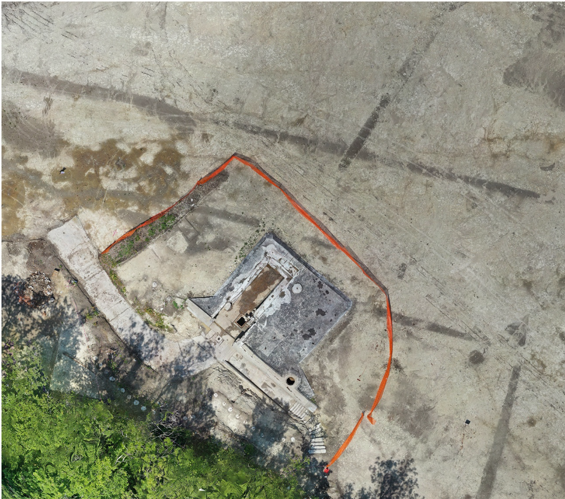
Figure n°5 : Plusieurs bunkers et structures datant de la Seconde Guerre mondiale étudiés dans le secteur de Royan

complexité de ce type de position, s'articulant autour d'ouvrages massifs en béton, de tranchées, trous de combat et réseaux techniques (électricité, gestion des eaux ou moyen de communication). Les secteurs de La Rochelle et de l'île de Ré ont également fait l'objet de recherches archéologiques ces dernières années. Depuis 2020, neuf opérations ont permis de découvrir et d'étudier directement des vestiges liés à la Seconde Guerre mondiale. Alimentées par des découvertes fortuites et par des travaux universitaires, les recherches se sont considérablement enrichies pour ce secteur, notamment sur la typologie des ouvrages bétonnés et sur leur adaptation à un paysage complexe, oscillant entre quartiers résidentiels, littoral, marais et absence de relief significatif.